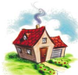
COMPRE SU CASA